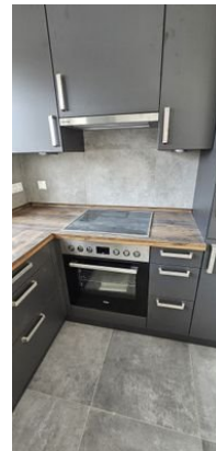
Backofen und Herd mit Induktion