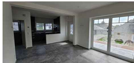
Wohnzimmer mit halboffener Küche