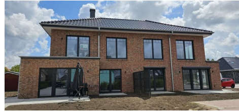
Nur 4 Wohneinheiten