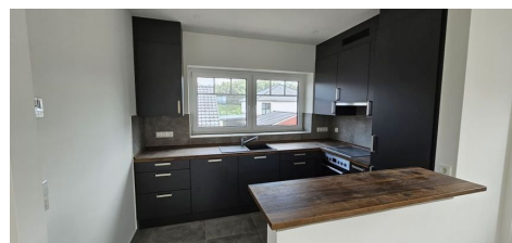
Küche mit Esstresen